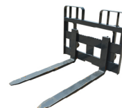
ВИЛЫ ДЛЯ ПОДДОНОВ